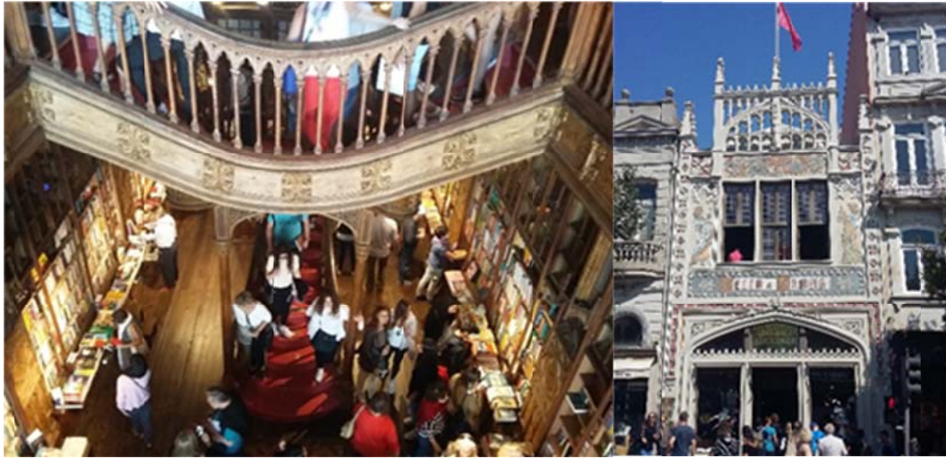
Zdj. 1, 2. Livraria Lello.

Uniwersytet w Porto (Universidade do Porto) został oficjalnie otwarty 22 marca 1911 r., jednak początki jego rozwoju sięgają XVIII wieku - kiedy to w 1762 r. utworzona została przez Józefa I Reformatora da Aula de Náutica - szkoła marynarska. Współczesny Wydział Sztuk Pięknych ma swoje początki w założonej w 1779 r. szkole rysunku Aula de Debuxo e Desenho, a w 1825 r. otworzono pierwszą szkołę medyczną w Porto - Real Escola de Cirurgia. W 1911 r. nastąpiła integracja wcześniejszych odrębnych szkół wyższych w ramach Uniwersytetu oraz tworzenie nowych wydziałów. W 1915 r. założony został Wydział Techniczny (od 1926 Wydział Inżynierii), w 1919 r. Wydział Literatury, a w 1925 r. Wydział Farmacji.