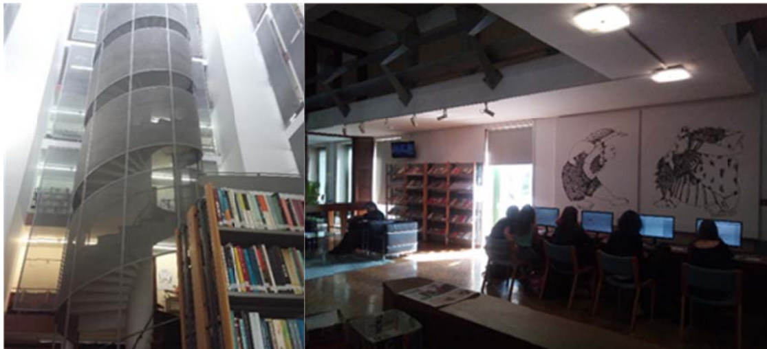
Zdj. 5, 6. Biblioteka Wydziału Humanistycznego Uniwersytetu w Porto.

Biblioteka otwarta jest od poniedziałku do piątku w godzinach 8.15-19.45, a w soboty od 9.00 do 13.00. W ciągu roku odwiedza ją około 150 000 użytkowników.