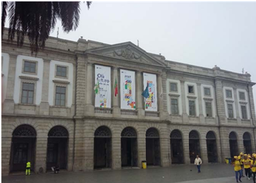
Zdj. 3. Gmach Uniwersytetu w Porto.

Kampus Uniwersytetu składa się z trzech centrów, rozproszonych po całym mieście: w centrum, w Aspreli (najbardziej na północ wysuniętej części miasta) i w rejonie Campo Alegre (na zachodnim brzegu rzeki Duero). Pomimo rozproszenia, poszczególne części uniwersytetu funkcjonują jako całość, często współpracując między sobą w ramach wspólnych projektów badawczych i szkoleniowych. Współpraca obejmuje dziesiątki jednostek badawczych, rozsianych po całym kampusie.