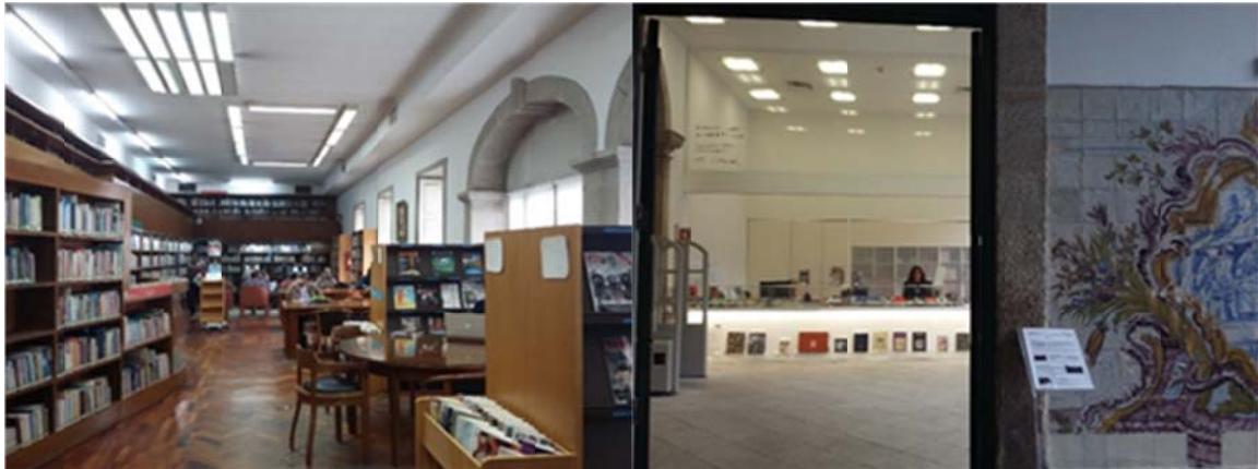
Zdj. 11, 12. Miejska Biblioteka Publiczna w Porto - wnętrza.

Miejska Biblioteka im. Almeidy Garrett w Porto (Biblioteca Municipal Almeida Garrett) została otwarta w 2001 r. jako druga biblioteka publiczna w mieście. Powstała w ramach przyznania Porto tytułu Europejskiej Stolicy Kultury, zyskując atrakcyjne usytuowanie w Ogrodach Kryształowego Pałacu.