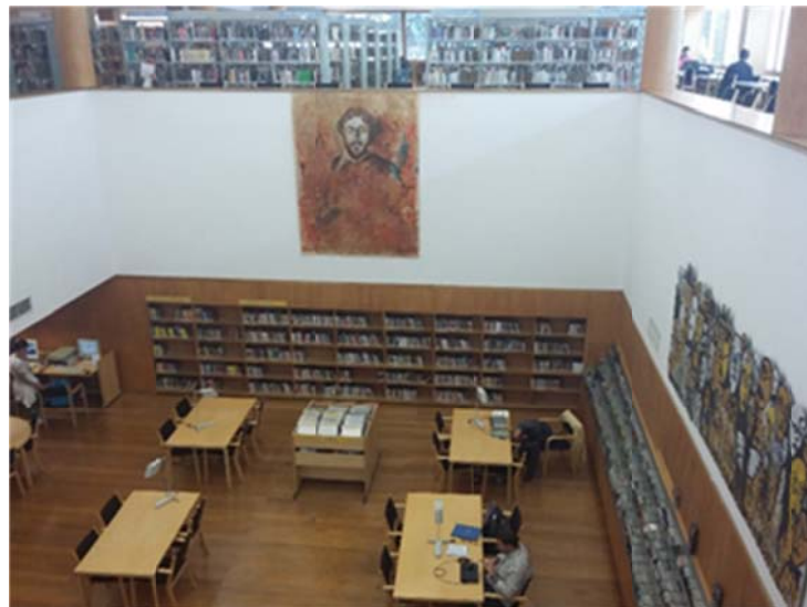
Zdj. 13. Biblioteka im. Almeidy Garrett w Porto - czytelnia.

Zbiory biblioteki wynoszą około 50 000 monografii, 7600 dokumentów multimedialnych i 700 tytułów wydawnictw periodycznych. Zarejestrowanych jest w niej ponad 1 300 000 użytkowników. W 2010 r. Biblioteka została włączona do UNESCO Network of Associated Libraries.