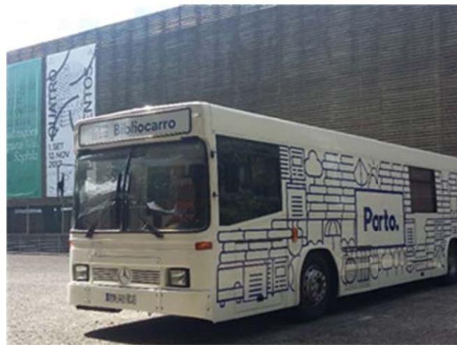
Zdj. 14. Bibliobus Miejskiej Biblioteki im. Almeidy Garrett w Porto.

W odróżnieniu od swojej poprzedniczki zlokalizowanej w zabytkowym budynku, biblioteka ta proponuje użytkownikom zupełnie inną - nowoczesnie zaprojektowaną przestrzeń otwartą i różnorodną jej wykorzystanie. Zajmuje dwa piętra i podzielona jest na trzy oddziały: Oddział dla Dzieci i Młodzieży, Czytelnię Główną oraz Oddział Multimedialny z wolnym dostępem do zbiorów. Miejski wydział kultury nakazał architektom stworzenie „biblioteki dla tych, którzy nie mają książek, miejsca gdzie można spokojnie poczytać, łatwo dostępnej, otwartej przestrzeni publicznej”, dlatego przestrzeń jest otwarta, ale z wieloma wydzielonymi „zakątkami” - dla różnych grup użytkowników, ale też ze względu na specyfikę zbiorów (czytelnia multimedialna, czytelnia internetowa). Biblioteka udostępnia samoobsługowe ksera, skanery i drukarki, stanowiska komputerowe, słuchanie muzyki na nośnikach winylowych i CD, oglądanie filmów na DVD i VHS, wi-fi.