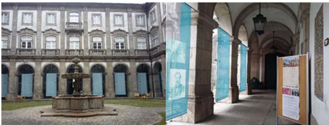
Zdj. 9, 10. Miejska Biblioteka Publiczna w Porto.

Miejska Biblioteka Publiczna w Porto (Biblioteca Pública Municipal do Porto) powstała w 1833 r. z dekretu cesarza Dom Pedro I jako Biblioteka Królewska, a od 1842 r. zajmuje obecną siedzibę, XVIII-wieczny dawny Klasztor Santo António da Cidade. Tworzenie księgozbioru zostało zainicjowane przez księgi pochodzące z dawnych bibliotek klasztorów i instytucji religijnych diecezji, a następnie uzupełniane przez kolekcje prywatnych darczyńców. Do 1842 r. zbiory wynosiły około 50 000 woluminów. W tym czasie zaczęły pojawiać się pierwsze drukowane katalogi biblioteki. W 1876 r. przez króla Luisa I została przemianowana na bibliotekę publiczną.