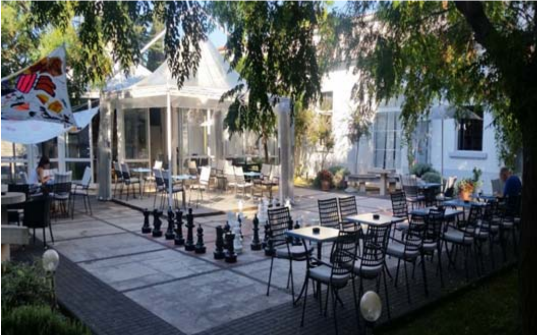
Zdj. 10. Biblioteka Miejska w Zadarze - dziedziniec.