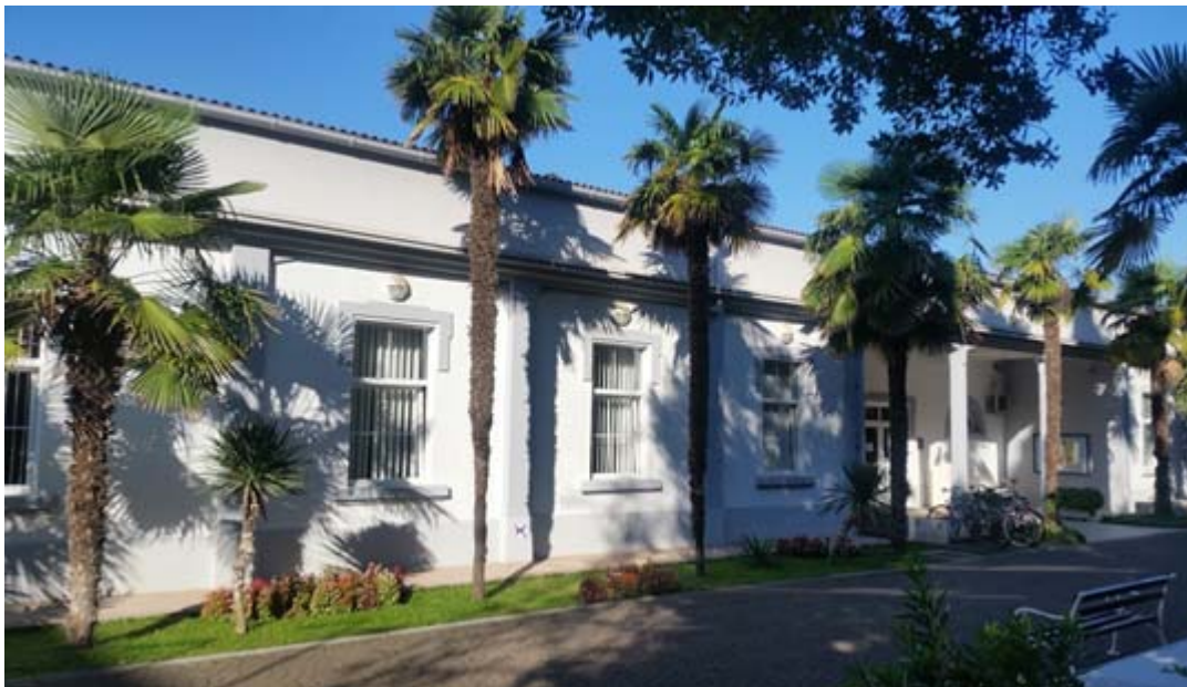
Zdj. 11. Biblioteka Miejska w Zadarze.

Dzięki różnorodnym i ciekawym inicjatywom biblioteka stała się centrum społeczności lokalnej. W roku odbywa się w niej ponad 400 imprez, permanentnie znajduje się także w centrum uwagi mediów. Każdego tygodnia ma tam miejsce konferencja prasowa, promująca inicjatywy biblioteczne, przygotowywany jest także cotygodniowy program telewizyjny.