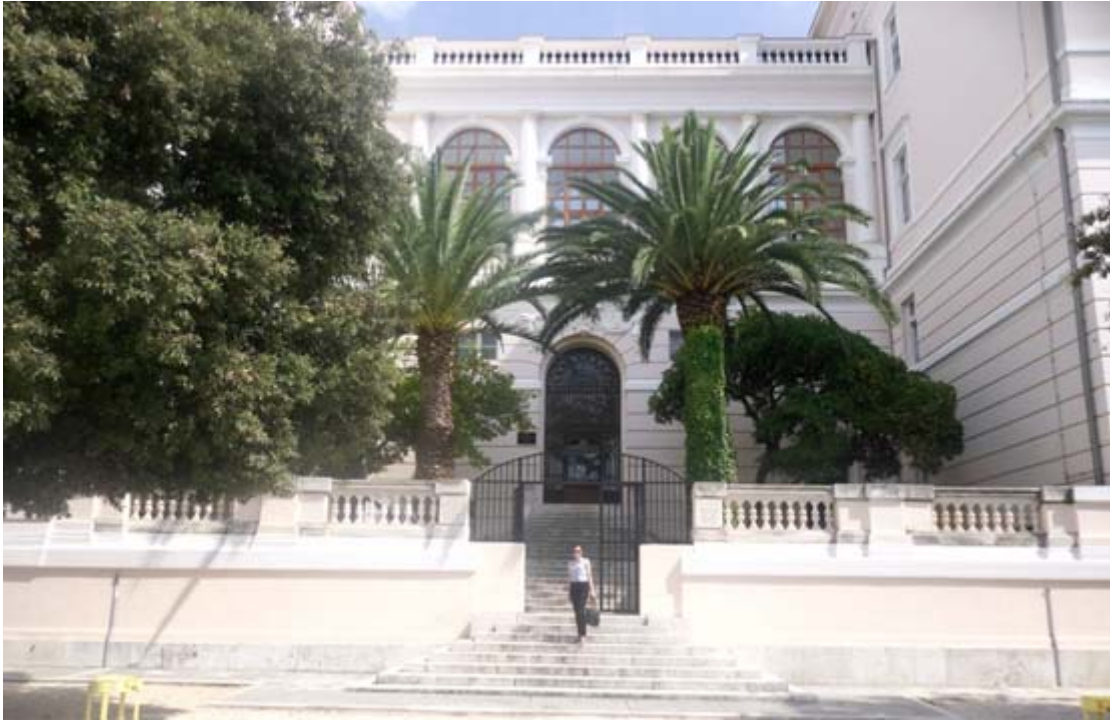
Zdj. 2. Gmach Uniwersytetu w Zadarze.

Biblioteka Uniwersytecka w Zadarze (Sveučilišna knjižnica u Zadru) rozpoczęła swoją działalność w 1956 roku, wraz z utworzeniem Wydziału Filozofii. Składa się na nią biblioteka centralna oraz biblioteki wydziałowe i instytutowe, mieszczące się podobnie jak sama uczelnia - w starym i nowym kampusie oraz w Gospić.