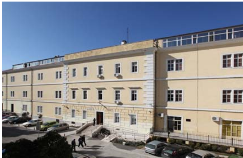
Zdj. 6. Biblioteka Naukowa w Zadarze.