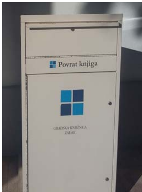
Zdj. 9. Bibliobox - zwroty wypożyczonych książek.

Biblioteka w Zadarze została wspomniana w wytycznych kodeksu dobrych praktyk Wspólnoty Europejskiej, zostając uznana za chorwacki wzorcowy model współczesnej biblioteki publicznej. W 2012 roku otrzymała tytuł Biblioteki Roku, przyznawany przez Chorwackie Stowarzyszenie Bibliotekarzy.