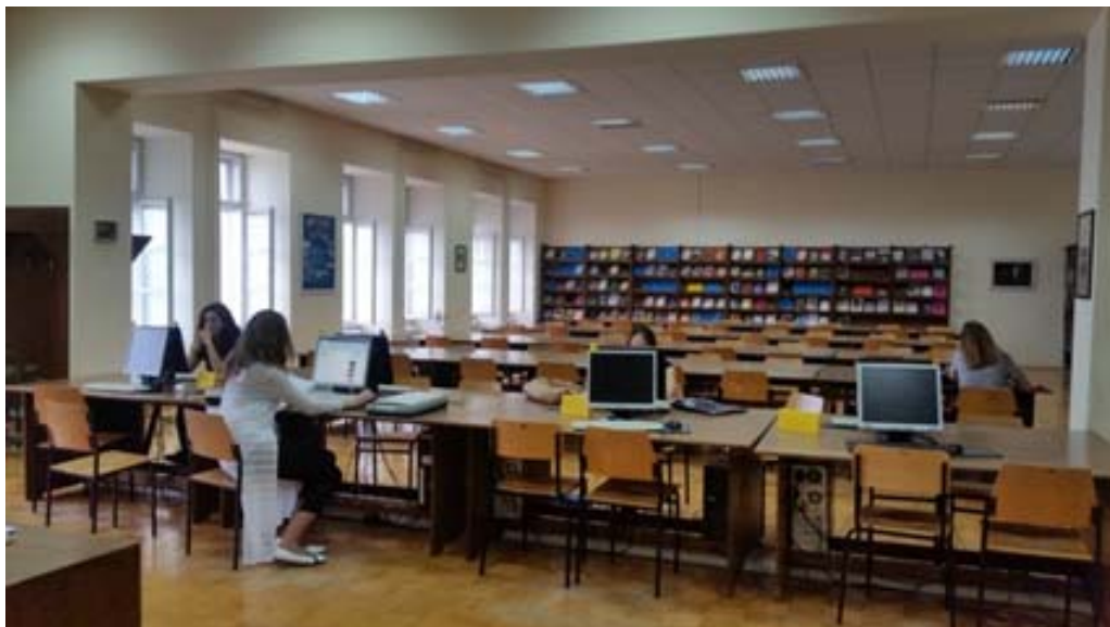
Zdj. 4. Czytelnia Biblioteki Uniwersytetu w Zadarze.

W 2015 roku rozpoczęto prace nad utworzeniem Cyfrowego Repozytorium Uniwersytetu (Digitalni repozitorij Sveučilišta u Zadru), będącego częścią krajowego systemu DABAR (cyfrowe archiwa naukowe i repozytoria). W pierwszej fazie projektu udostępnione zostaną prace dyplomowe i doktoranckie studentów Uniwersytetu w Zadarze, a następnie artykuły recenzowane, materiały konferencyjne, książki, materiały dydaktyczne, pliki audio i wideo, prezentacje.