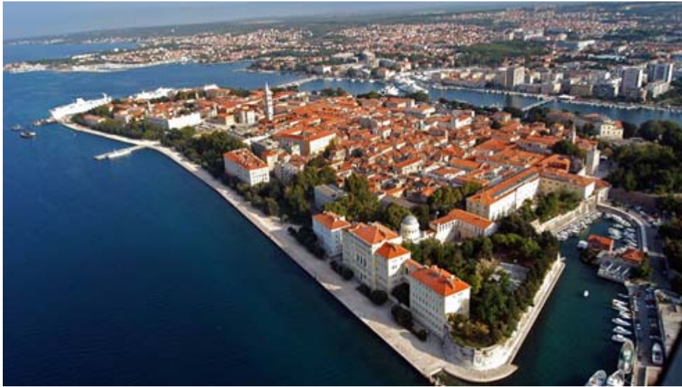
Zdj. 1. Zadar.

Tradycja szkolnictwa wyższego w Zadarze jest najdłuższa w Chorwacji. Sięga ona XIV wieku, kiedy to w 1396 roku założona została dominikańska uczelnia Studium Generale (później Universitas Jadertina) z prawem do nadawania najwyższych tytułów naukowych, działająca przez cztery wieki, aż do zawieszenia jej w 1807 roku przez władze francuskie. W późniejszym okresie rozwój edukacji wyższej kontynuowany był w tzw. Liceum - Szkole Głównej (prawo, medycyna, architektura, farmacja, teologia) oraz w Seminarium Teologicznym Florio.