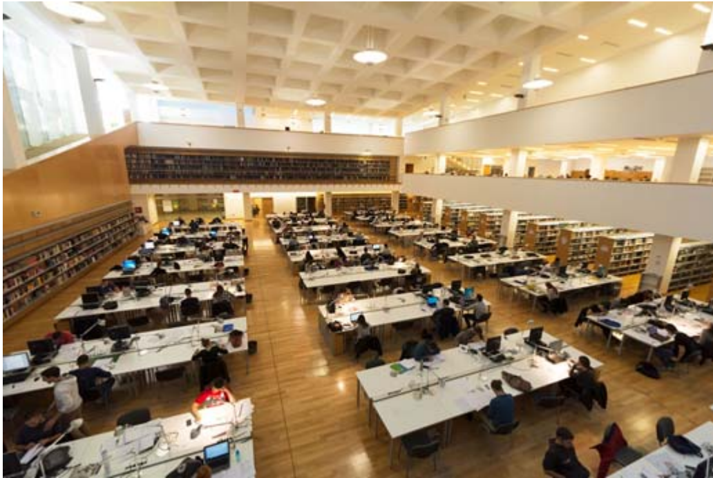
Zdj. 13. Biblioteka Uniwersytetu w Splicie - czytelnia główna.

Komputeryzację biblioteki rozpoczęto na przełomie lat 1991/92. Obecnie instytucja pracuje w systemie CROLIST, stosowanym w większości bibliotek naukowych w Chorwacji. Od 1990 roku Biblioteka Uniwersytetu w Splicie jest odpowiedzialna za katalogowanie w procesie publikacji - zapis CIP w książkach wydawanych w Dalmacji.