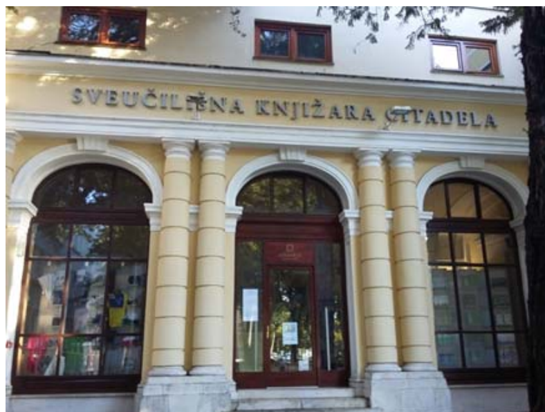
Zdj. 5. Księgarnia Naukowa Uniwersytetu w Zadarze.

Autorzy artykułu odwiedzili także kilka uniwersyteckich bibliotek wydziałowych. Jedną z nich była Biblioteka Wydziału Sławistyki, mieszcząca się w starym kampusie. Jest ona najstarszą i największą uniwersytecką biblioteką wydziałową. Powstała w 1956 roku wraz z Zakładem Sławistyki. Obecnie jej zbiory (m.in. z dziedziny literatury pięknej, językoznawstwa, stylistyki, historii i teorii literatury, literatury krytycznej) obejmują około 30 000 woluminów. Cenne i rzadkie pozycje udostępniane są jedynie w czytelni. Z kolei Biblioteka Nowego Kampusu, utworzona w 2001 roku, powstała po przemieszczeniu Instytutu Geografii, Wydziału Turystyki i Nauk o Komunikacji oraz Departamentu nauczycieli i wychowawców do nowego budynku. Biblioteka zapewnia wolny dostęp do zbiorów, udostępnia bazy danych, miejsca pracy z komputerami w czytelni, skanery, Wi-Fi. Z bibliotek wydziałowych mogą korzystać wszyscy studenci i pracownicy Uniwersytetu. Regulamin korzystania ze zbiorów jest ujednoczony dla wszystkich bibliotek, różne są jedynie godziny otwarcia.