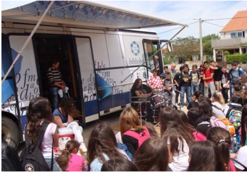
Zdj. 8. Bibliobus Miejskiej Biblioteki w Zadarze.