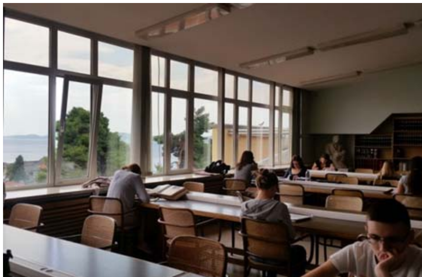
Zdj. 7. Biblioteka Naukowa w Zadarze - czytelnia.