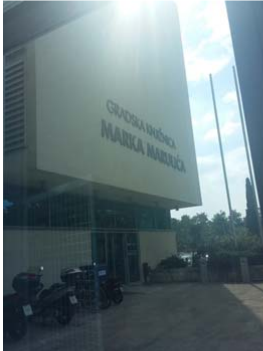
Zdj. 14. Miejska Biblioteka Publiczna im. Marka Marulića w Splitcie.

Miejska Biblioteka Publiczna im. Marka Marulića to bez wątpienia ważny punkt na mapie kulturalnej Splitu. Instytucja dysponuje salą konferencyjną, kilkoma czytelniami oraz miejscami do pracy indywidualnej. Odbywają się tu promocje książek, pokazy filmowe, dyskusje, recitale, warsztaty i kursy językowe.