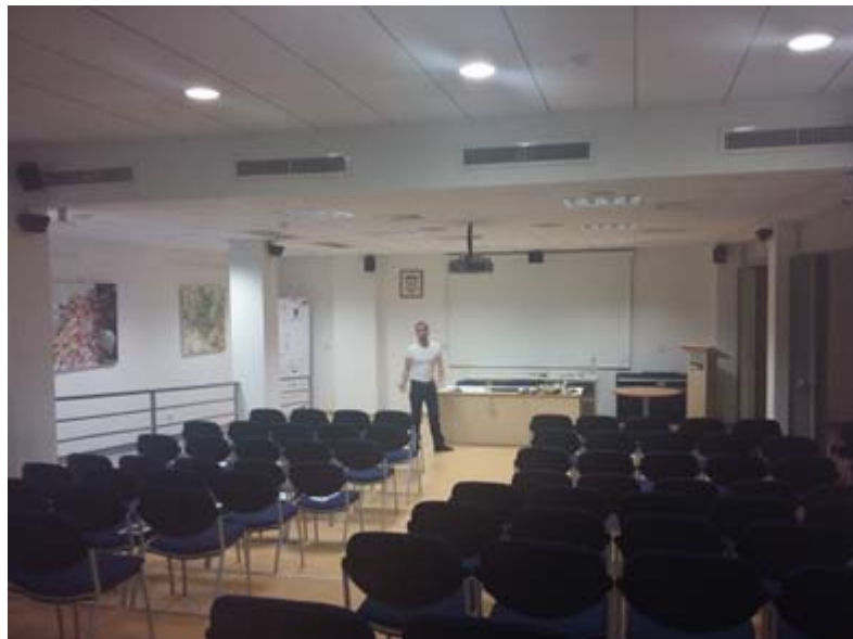
Zdj. 15. Miejska Biblioteka Publiczna im. Marka Marulića - sala konferencyjna.