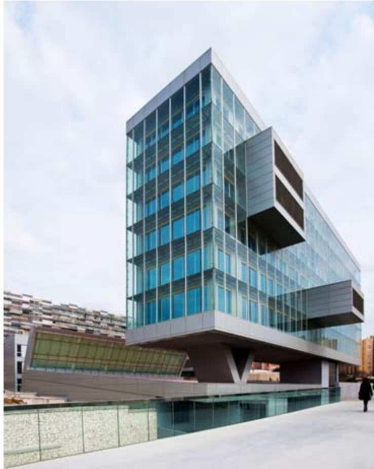
Zdj. 12. Gmach Biblioteki Uniwersytetu w Splicie.

Od 2009 roku biblioteka uniwersytecka funkcjonuje w przestronnym nowoczesnym budynku na terenie kampusu. Lokalizacja ta zapewnia optymalne warunki przechowywania i pracy ze starymi zbiorami. Biblioteka posiada też profesjonalny oddział konserwacji księgozbioru.